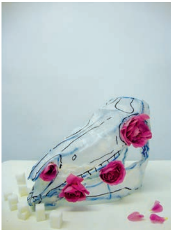
Titel, material year